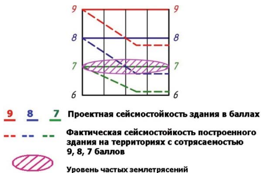
Рис. 1. Ориентировочное соотношение проектной и фактической сейсмостойкости современных зданий (Ш.А. Хакимов, 2016)

Такие изменения общепринятых явлений можно объяснить снижением со стороны правительства общего уровня финансирования и поддержки строительной науки, экспериментальных исследований, резким ухудшением качества проектирования и строительства. В условиях изменившейся социальной и государственной формации общества, в строительстве установился диктат бизнеса, псевдорынка, когда за привлекательностью фасадов зданий скрыты, как бы экономичные, но недостаточно надежные в сейсмическом