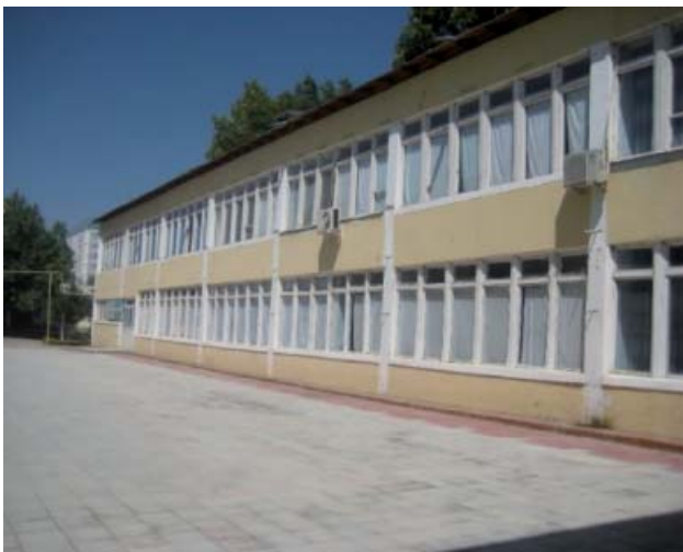
Рис. 3. Внешний вид учебного корпуса городской школы

На основании анализа инструментальных наблюдений по оценке сейсмостойкости зданий по методу HVSR выявлены пределы сейсмических воздействий, при превышении которых начинается структурное разрушение конструкций здания.