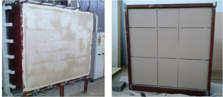
Рис.1. Вигляд кладки на основі багатошлішних керамічних блоків з внутрішньої (а) та зовнішньої (б) сторони.

Метою експериментальних випробувань є визначення фактичного значення опору повітропроникності огорожувальних конструкцій з вентиляємим прошарком на основі кладки з керамічних багатошлішних блоків та цільних керамічних блоків, встановлення відповідності нормативним вимогам [9] за показником повітропро-